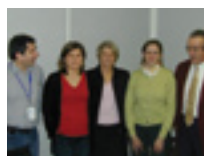
Le comité d'organisation local est constitué de :